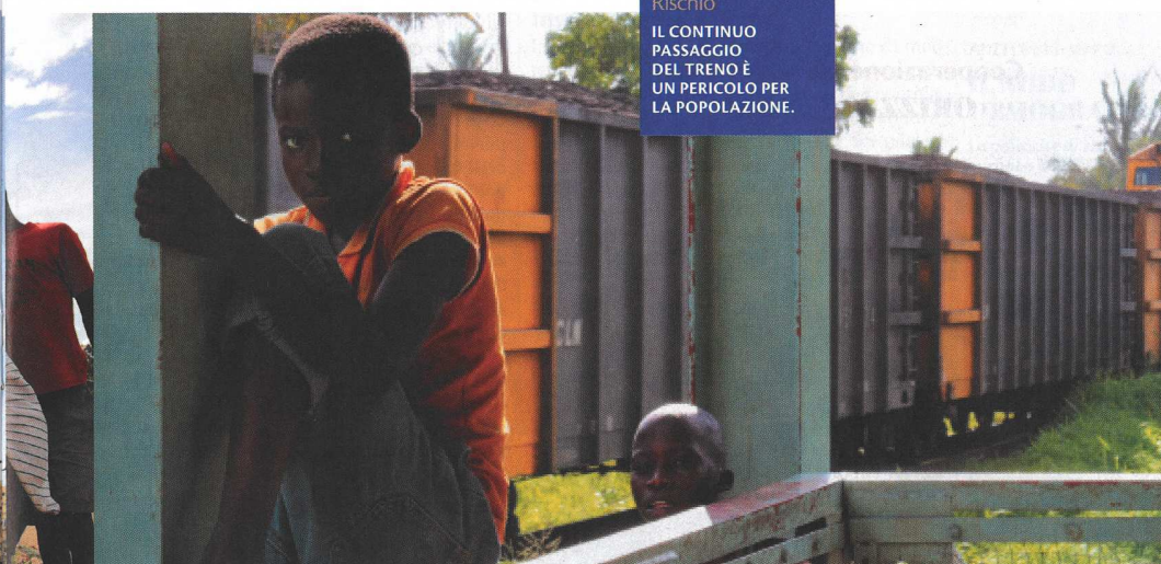
Rischio IL CONTINUO PASSAGGIO DEL TRENO È UN PERICOLO PER LA POPOLAZIONE.

PRESIDENTE E AMMINISTRATORE DELEGATO DI VALE