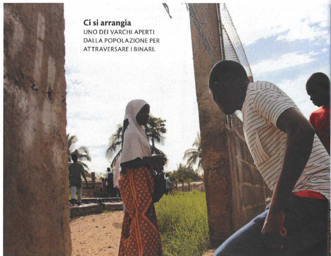
Ci si arrangia UNO DEI VARCHI APERTI DALLA POPOLAZIONE PER ATTRAVERSARE I BINARI.

Le rotaie che stanno rendendo insostenibile la vita