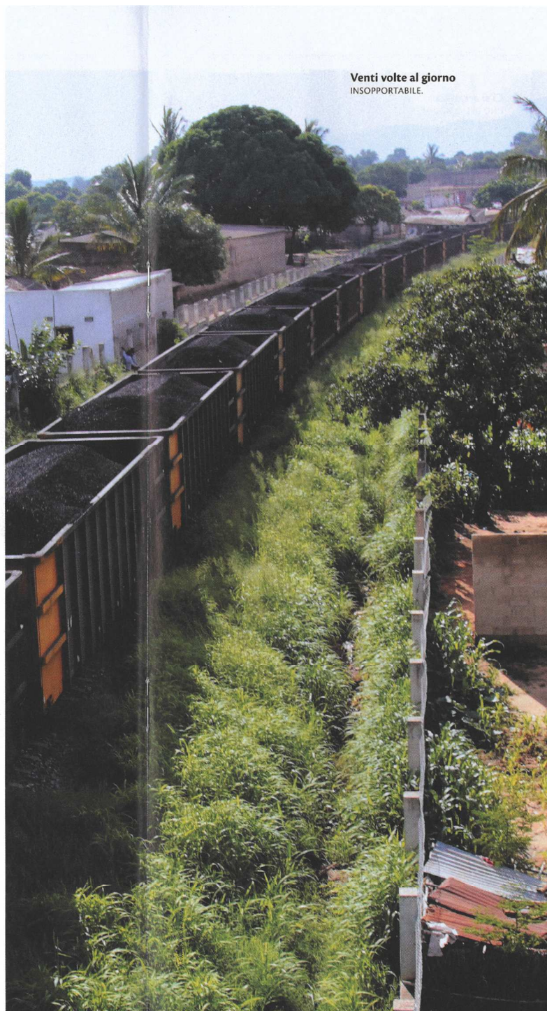
Venti volte al giorno INSOPPORTABILE.

«È il treno della Vale e dei giapponesi. Trasporta il carbone dalle miniere fino all'oceano. Passa venti volte al giorno. Vedi quelle barriere? Hanno tagliato in due la città... Io lavoro dall'altra parte ▶